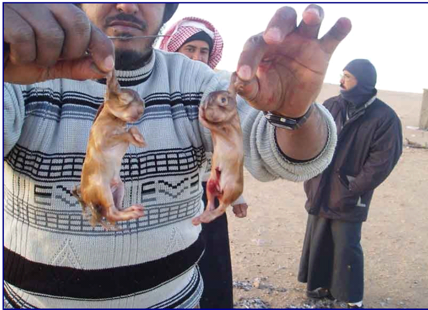
الصيد الجائر تسبب في القضاء على الكثير من الأنواع الفطرية.