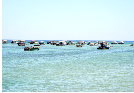
وظيفة مرافق لا تزال تعطل مراكب الإبحار