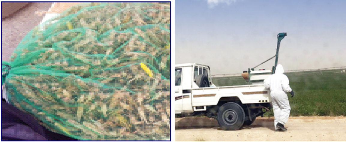
استنفار لمكافحة الجراد في الأحساء كيس جرادة جملة معروض للبيع في الأحساء أمس