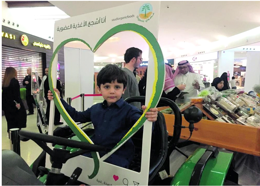
مشاركة الزوار في الحملة