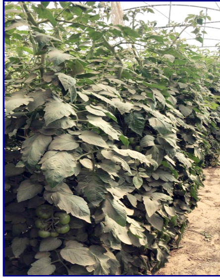
نشاط الذبابة البيضاء بين منتصف مارس ويونيو سنوياً.