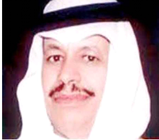
كتبه مقبول بن فرج الجهني

خادم الحرمين الشريفين الملك سلمان بن عبدالعزيز حفظه الله عندما قال "الأمن أكبر نعمة في بلادنا" يعطي دلالة واضحة على الامن والامان والاستقرار التي تفخر بها مملكتنا العزيزة. وتأكيد خادم الحرمين الشريفين رعاه الله وهو يؤكد ان النعمة الكبرى في بلادنا "هي الأمن" وانه يتشرف بأن يكون خادماً للحرمين الشريفين..