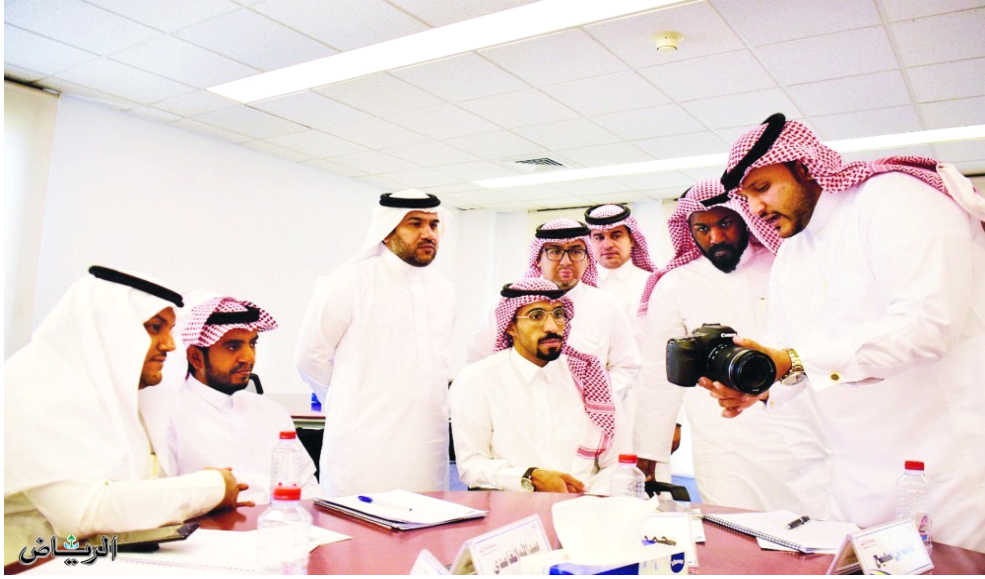
4 شغف المشاركين باكتساب مهارات التصوير المقدمة خلال دورة «فن التصوير»