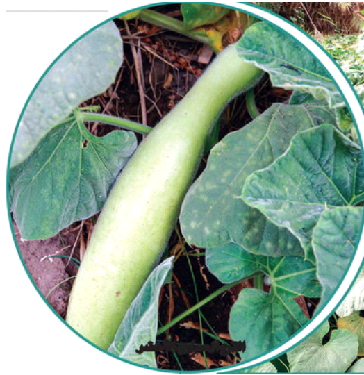
القرع الحساوي الأخضر