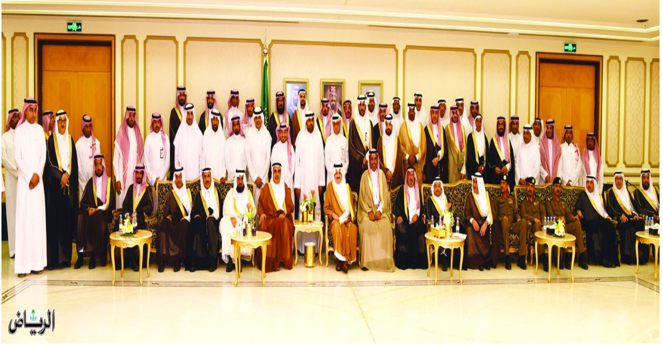
الأمير سعود بن نايف يكرم المشاركين في فعاليات البيئة الدمام - سالم السبيعي

شدد صاحب السمو الملكي الأمير سعود بن نايف بن عبدالعزيز، أمير المنطقة الشرقية على أهمية استمرار الجهود التوعوية للحفاظ على البيئة، مؤكداً أن الحفاظ على البيئة واجب شرعي و وطني وأخلاقي، لا بد من العمل عليه، وغرس هذه القيمة في نفوس الناشئة، جاء ذلك خلال تكريم سموه للجهات المشاركة في فعاليات أسبوع البيئة 1440 هـ بديوان الإمارة.