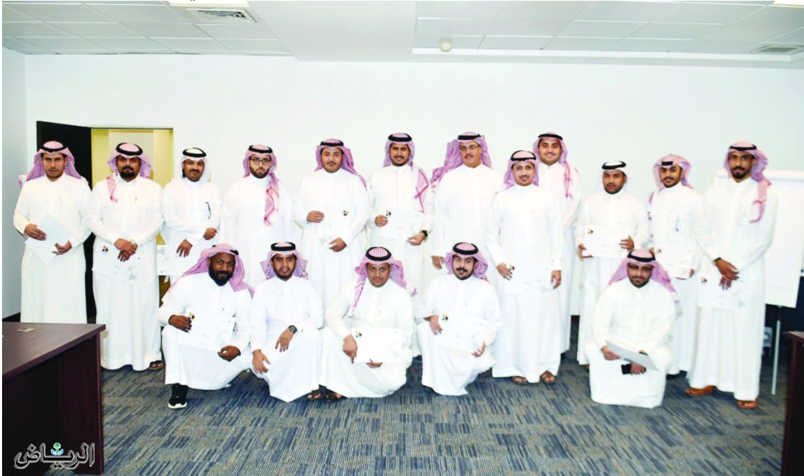
المتدربون ينصتون لتوجيهات المدرب الحارثي