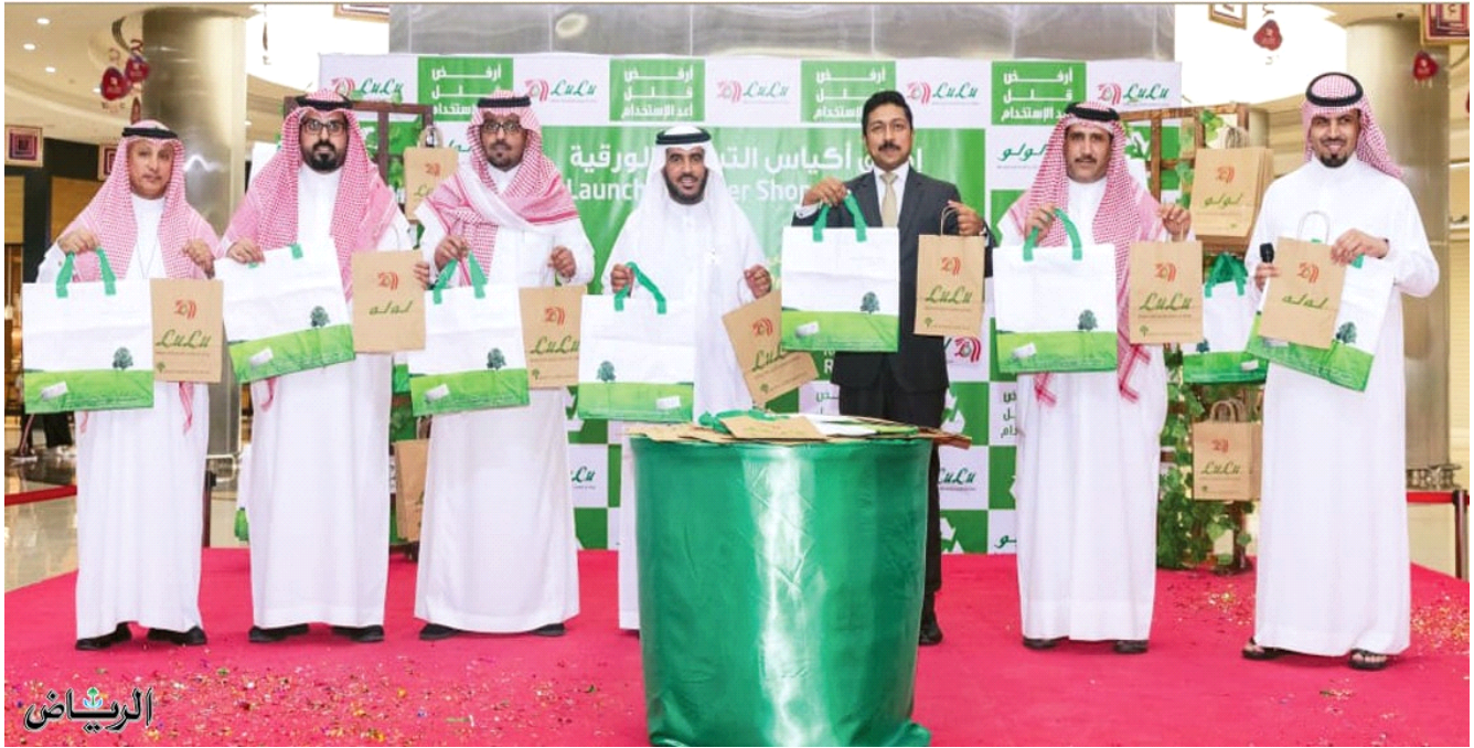
صورة تذكارية أثناء الإعلان عن مبادرة «لولو»