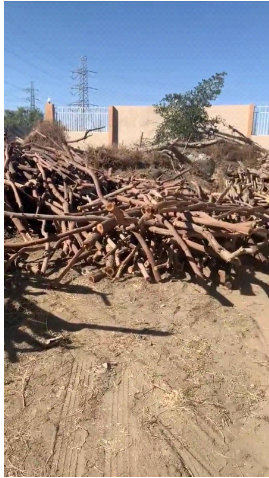
حطب تمت مصادرته