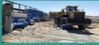
معدات البلدية تزيل المواقع المخالفة (اليوم)