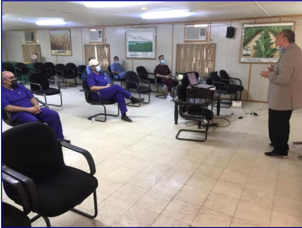
إيصال المعلومات الصحيحة بأسلوب سهل (اليوم)