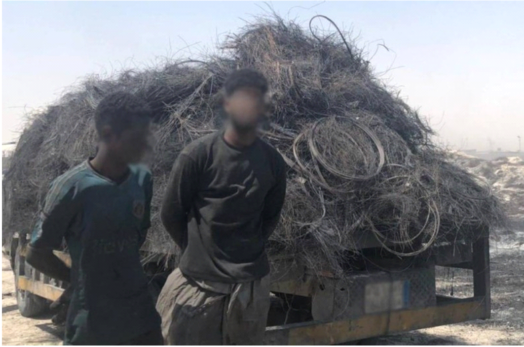
ضبط اثنين من مضمري النار في الإطارات (المركز الوطني للرقابة على الالتزام البيئي)