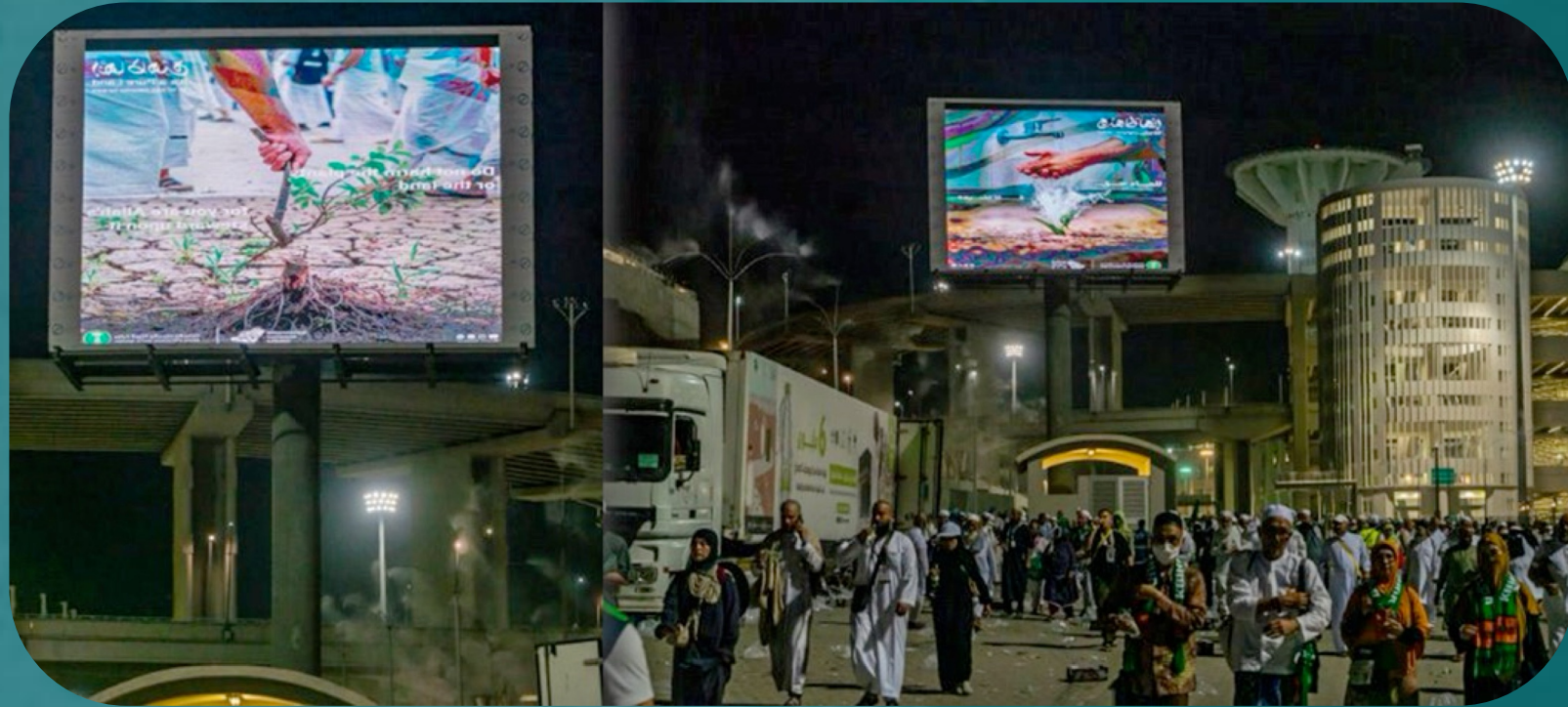
أمثلة للافتات الطرق