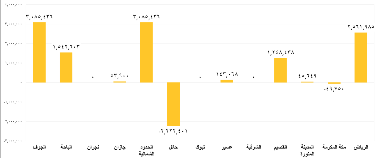
مقدار التغير في حجم تخزين السدود (3م) في جميع المناطق بين يومي الجمعة 2026/04/24 و السبت 2026/04/25