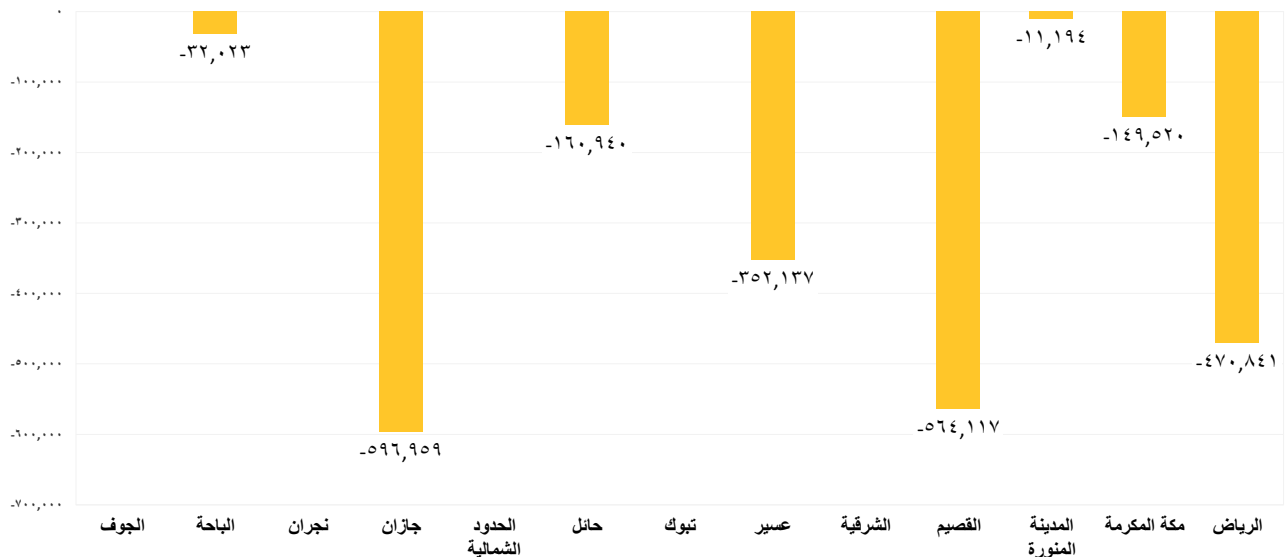
مقدار التغير في حجم تخزين السدود (3م) في جميع المناطق بين يومي الأحد 2026/05/10 الإثنين 2026/05/11م