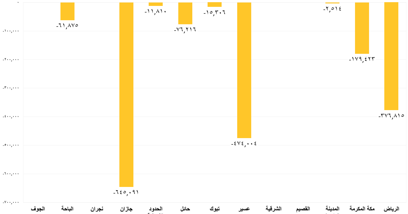
مقدار التغير في حجم تخزين السدود (3م) في جميع المناطق بين يومي الجمعة 2026/06/12م السبت 2026/06/13م