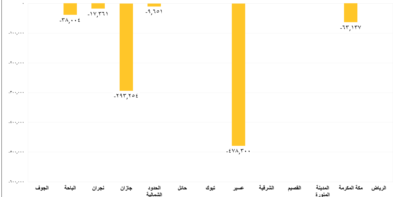
مقدار التغير في حجم تخزين السدود (3م) في جميع المناطق بين يومي الإثنين 2026/05/25 الثلاثاء 2026/05/26م